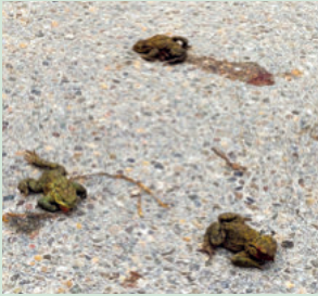
Krötenwanderung am Benediktenweg

Mit dem Frühlingsbeginn wandern Frösche, Kröten und Molche wieder zu ihren Laichgewässern. Dabei sind sie besonders durch den Verkehr stark gefährdet. So wurden am Inselweiher und am Ende des Benediktenwegs im vergangenen Jahr trotz Warningschildern erneut viele Kröten überfahren. Bei Geschwindigkeiten über 30 km/h können Amphibien schon durch den Luftdruck vorbeifahrender Autos tödlich verletzt werden – auch ohne direkten Kontakt. Bitte fahren Sie in der Nähe von Laichgewässern langsam und aufmerksam, besonders nachts, bei Regen und bei Temperaturen über 5 °C. Wenn möglich, meiden Sie diese Strecken während der Hauptwanderzeiten und nutzen Sie alternative Routen. Es sind nur wenige Nächte im Jahr, die entscheidend sind.