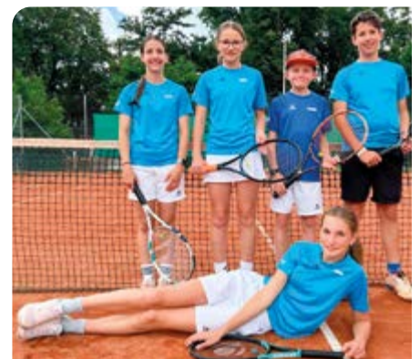
Meister U15 III

Frohe Weihnachten und die besten Wünsche für das Jahr 2026