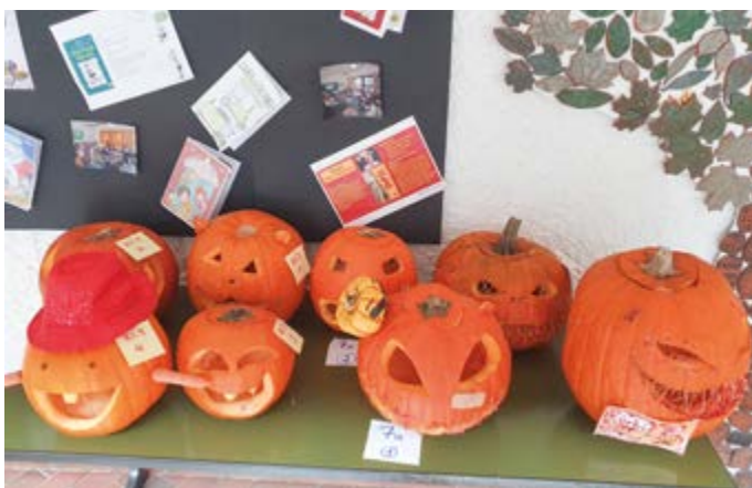
Text: H. Hackl

Ende Oktober stand an der Johann-Andreas-Schmeller-Mittelschule alles im Zeichen von Kürbissen und Kreativität. Alle Klassen beteiligten sich begeistert am Kürbis-Schnitz-Wettbewerb. Von fröhlichen Gesichtern bis zu gruseligen Monstern – die Schüler ließen ihrer Fantasie freien Lauf. Die schönsten Werke wurden in der Aula ausgestellt, wo alle ihre Favoriten wählen konnten. Am 30. Oktober fand die Siegerehrung statt: Die Schülersprecher führten charmant durch das Programm, Preise und Urkunden belohnten die kreativsten Schnitzer. Der Wettbewerb sorgte für Teamgeist und herbstliche Stimmung – die Vorfreude auf das nächste Halloween ist schon groß – denn eines ist sicher: Der Kreativität sind bei den Schülerinnen und Schülern der Johann-Andreas-Schmeller-Mittelschule keine Grenzen gesetzt!