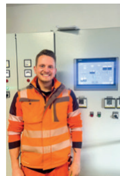
Technisch top organisiert mit Fernabfrage über das Smartphone