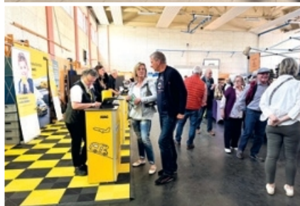
Vor allem am Sonntag herrschte reger Betrieb in der Grundschulturnhalle, die zur Messehalle umfunktioniert worden war.

sammelte Spenden für ein dringend benötigtes neues Einsatzfahrzeug. Bundestagsabgeordneter Christian Moser nahm sich fast vier Stunden Zeit für den Messerundgang und stand allen Ausstellern und Vereinen für ausführliche Gespräche bereit. Der Samstagabend klang mit einem Entenessen im Theatersaal und einem Konzert der Coverband „Basement 27“ aus, welche anhaltenden Beifall für ihren Gig bekam.